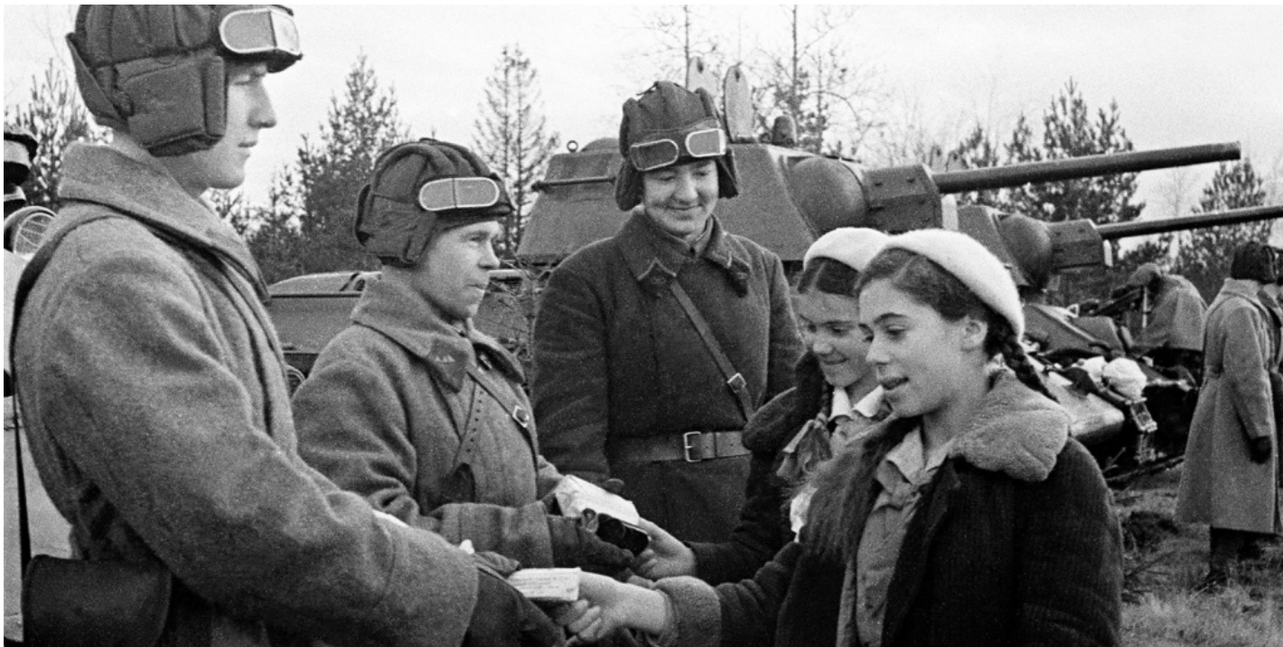
Во время передачи танковой колонны «Московский пионер», построенной на средства пионеров Москвы и области, бойцам Красной армии. Автор С.И. Васин. Московская область. 1942 год. Главархив Москвы