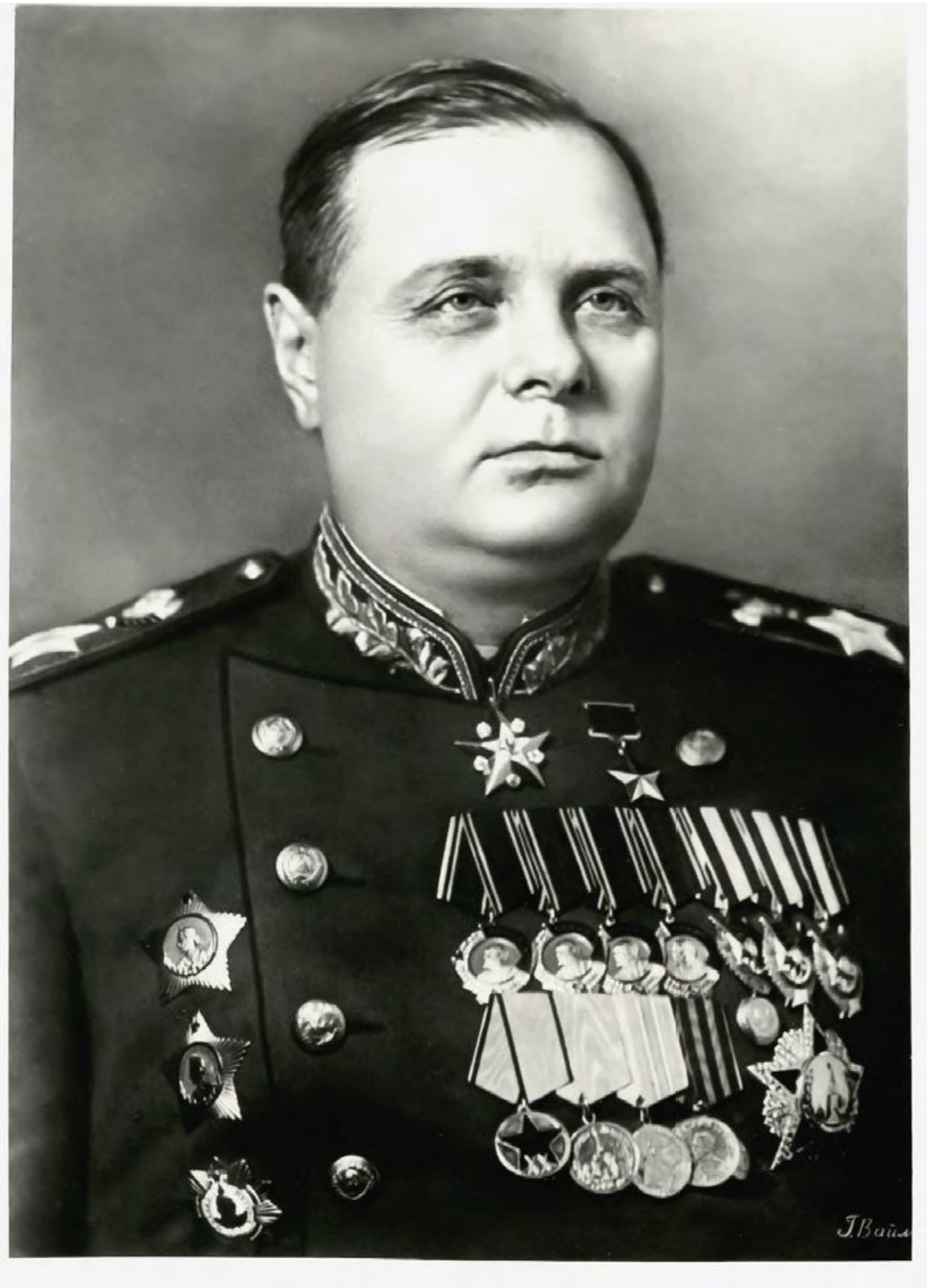
Фотография К.А. Мерецкова. [1951 г.]

Заместителю командира эскадрильи 63-го гвардейского истребительного авиационного полка Маресьеву Алексею (1916–2001) звание Героя Советского Союза было присвоено 24 августа 1943 года за образцовое выполнение заданий командования на фронте борьбы с немецкими захватчиками и проявленные при этом отвагу и героизм. 4 апреля 1942 года в воздушном бою в районе Демянского плацдарма самолет гвардии старшего лейтенанта Маресьева был подбит. После ампутации голени обеих ног он освоил протезы, прошел медкомиссию и в июне 1943 года вернулся в строй. С августа 1941 года по август 1943 года Алексей Маресьев совершил 86 боевых вылетов, осуществил 20 штурмовок живой силы и военной техники противника, сбил шесть вражеских самолетов.