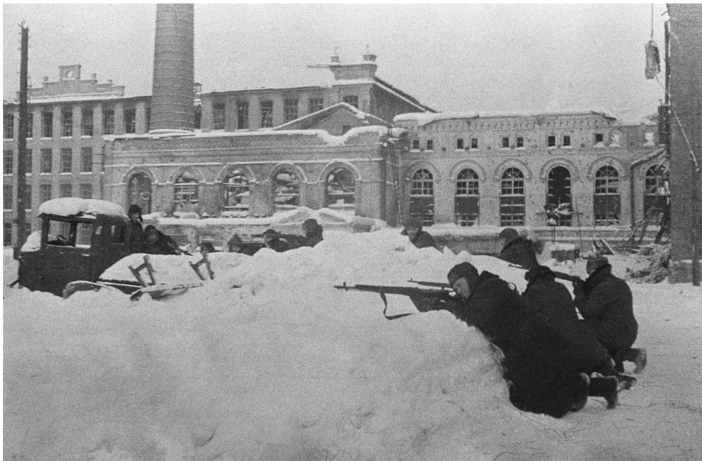
Группа партизан Наро-Фоминского партизанского отряда на линии обороны во дворе прядильно-ткацкой фабрики. Московская область, г. Наро-Фоминск. Не позднее 26.12.1941 г.

29 июня в России отмечается День партизан и подпольщиков. Главархив рассказывает об их вкладе в Победу на основе военных документов.